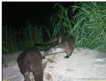
Loutres sur l'Orne - mars 2007

Des habitats naturels d'intérêt européen existent aussi sur le site. Il s'agit des :