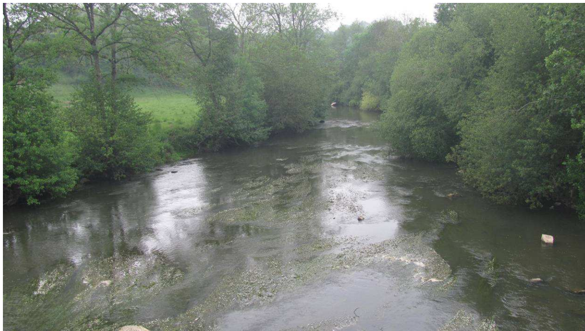
Pont de la Villette - Herbiers à renoncules aquatiques : habitat d'intérêt européen.